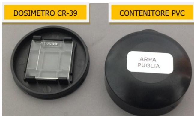
Figura 1a. Immagine del CR-39 e del contenitore in PVC.