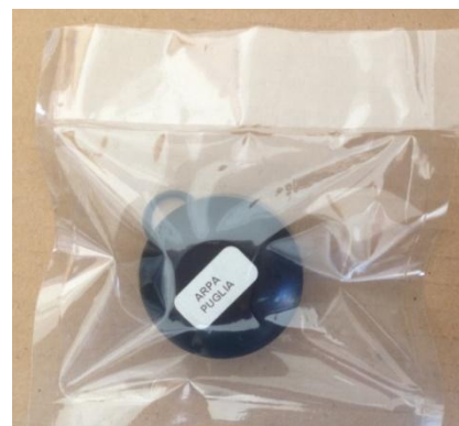
Figura 1b. CR-39 in busta impermeabile al radon.

Le specifiche tecniche dei dosimetri CR-39 sono riportate in Tabella 1.